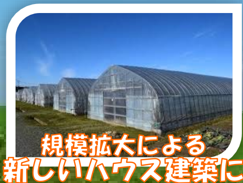
規模拡大による 新しいハウス建築に