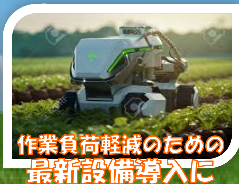
作業負荷軽減のための 最新設備導入に