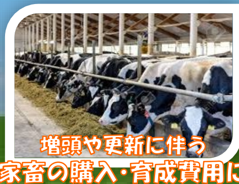
増頭や更新に伴う 家畜の購入・育成費用に

JAバンクでは農業者の皆さまのお借入負担を軽減するため、 農業近代化資金のお借入れにかかる金利を助成いたします。