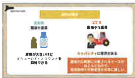
フレームワーク解説