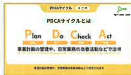
組織マネジメント