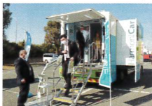
協力：肥後銀行 S10 (20日のみ)