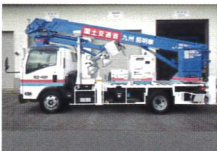
協力：九州地方整備局 J4・S14