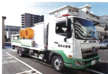
協力：九州農政局 J5・S13