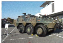
協力：陸上自衛隊 J8・S12