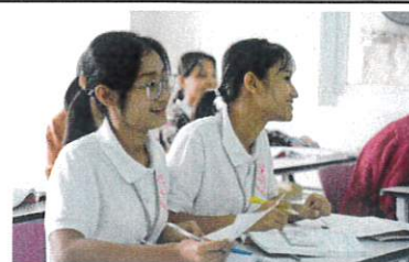
Sakura Japanese Academy (ヤンゴン、ミャンマー) 来熊前の介護技能実習生