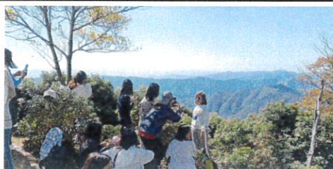
県内製造業技能実習生 五木村トレッキングイベント