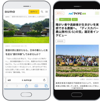
メディア媒体（アウモ、マイナビ）での記事掲載