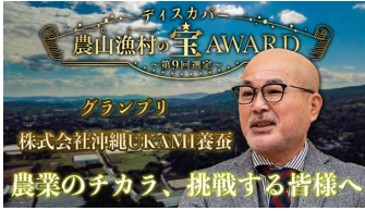
取組紹介のPR動画（グランプリ地区）