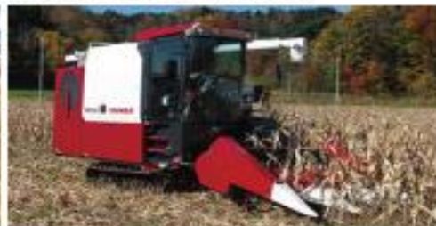
YH1150A 用 3軸コーンヘッダー：CH3R,1150A-JP