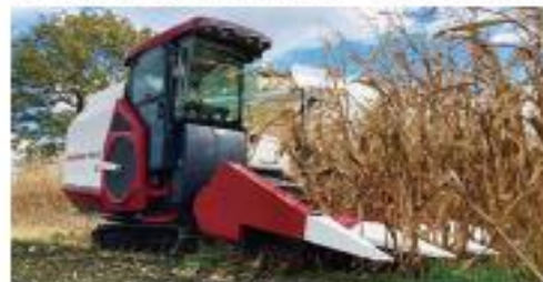
YH700M 用 3軸コーンヘッダー：CH3R,700MT-JP

難しい操作なしで速やかに刈取り、ローリングカッターによる雌穂と茎葉の分離でキレイに選別できます。