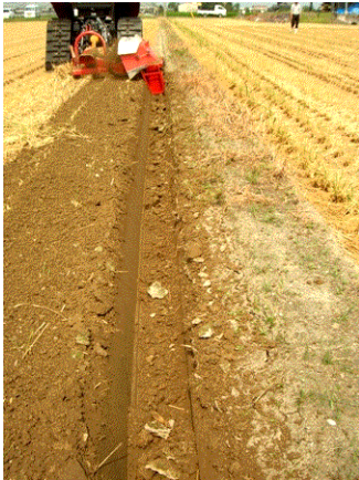
【水田露地は額縁明渠を設ける】

排水経路を点検し、畝溝や排水溝、明渠、暗渠等の排水機能を改善しておく。併せて、除草等も実施して、ほ場周囲の環境改善を行っておく。また、ほ場への雨水浸入に備えて、ポンプ等を準備し強制的に排水できるよう準備しておく。