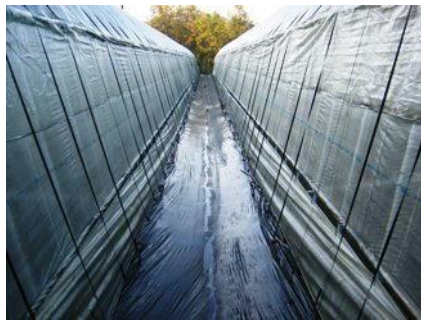
【ハウス内への滲入防止対策】