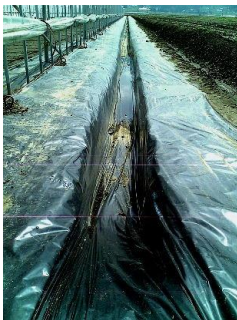
【ハウス周辺の排水路】 （マルチ展張で崩れ・雑草・浸水防止）