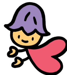
熊本県人権啓発 キャラクター 「ココロ」