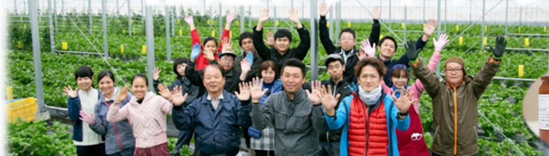
写真左:鳥越ファームの皆様 写真下:有機トマト加工品