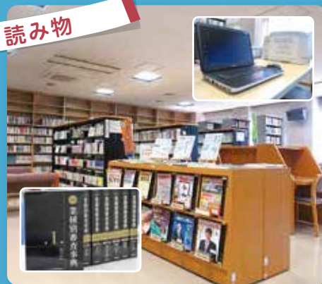
考えを研ぎ澄ませる時間 静かな環境で“ひらめき”に出会う