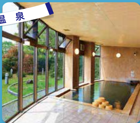
「美人の湯」とも呼ばれる、名物の人吉温泉は、疲れた体を癒す