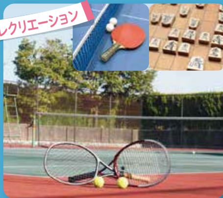
テニス・卓球・バレー・フットサル 囲碁・将棋・映画 (DVD) など充実