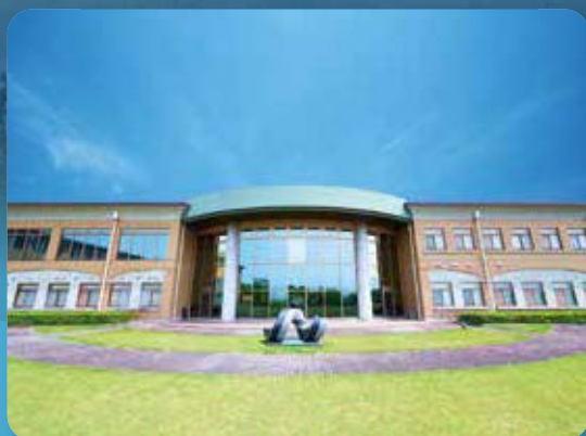
綺麗な設備・開放的空間