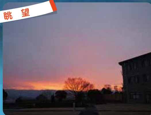
山々に囲まれた隠れ里を一望