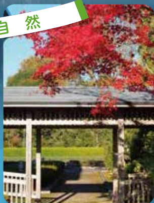
四季折々の美しい自然