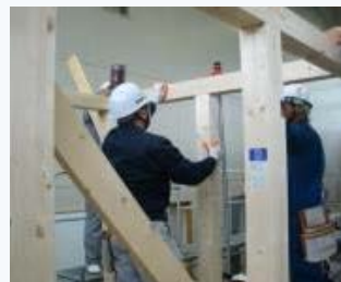
▲ 木造軸組加工法による建物組立の実習

「ハロートレーニング-急がば学べ-」とは、新たなスキルアップにチャレンジするすべてのみなさんをサポートする公的職業訓練の愛称とキャッチフレーズです。