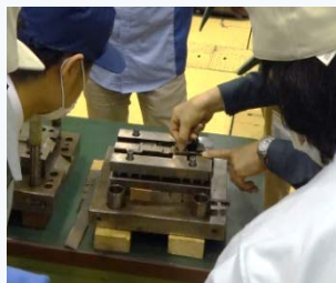
▲ 金型設計において考慮すべきトラブル対策実習