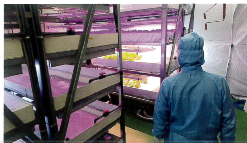
▲植物工場内を案内するバーチャルラボツアー動画の様子

研究成果紹介の動画やなかなか立ち入ることのできない研究施設内を案内するバーチャルラボツアー、九沖研育成品種をご家庭の食卓でも手軽に召し上がれるレシピ紹介など、オンライン一般公開ならではのコンテンツを公開しました。見た方からは「普段見ることのできないところを見られてとても面白かった。」「九州まで行かずにオンラインで見られるので大変良かった。」などの感想が寄せられました。