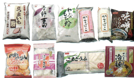
▲サツマイモでん粉を使った一般商品例

本品種の育成は、生研支援センター「イノベーション創出強化研究推進事業」（高品質・多収なでん粉原料用カンショ品種の育成）の支援を受けています。