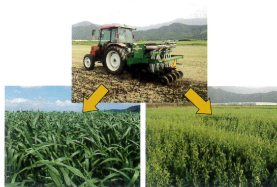
▲図2 不耕起播種作業の様子(上)と不耕起栽培で生育する2作目のスーダングラス(左下)と3作目のエンバク(右下)