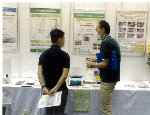
▲来場者と意見交換を行う研究者(右)

令和3年6月16日～17日に、日本の農業ビジネスに関連する最先端技術と製品を展示する専門展示会である九州アグロ・イノベーション2021がマリンメッセ福岡において開催され、九沖研からは「NARO方式乾田直播一毛作水田でもできる振動ローラ式乾田直播」を出展しました。この技術は、水稻の乾田直播栽培(苗移植ではなく畑状態に直接種まきする栽培方法)で問題となる漏水を、振動ローラを用いた土壌の鎮圧によって防止する技術です。会場では技術の概要についてパネル展示を行い、普及に向けてのアンケート調査も行いました。