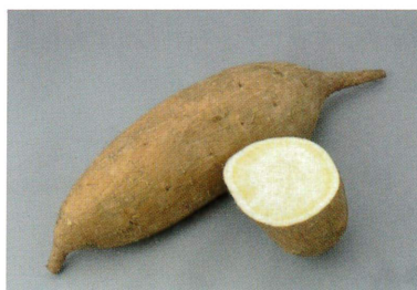
◀「こないしん」の塊根

サツマイモでん粉は、南九州の地域経済を支える重要な品目の一つです。以前は、その用途の多くはぶどう糖や水飴などの糖化製品原料でしたが、片栗粉や葛粉の代替、お菓子、麺類、水産練り製品などサツマイモでん粉の特徴を活かした食品用途への利用が年々増加しています。これまで、多収で、でん粉品質に優れた品種「シロユタカ」が、長年、でん粉原料の主力品種として使われてきました。しかし近年、農家数の減少や単収の低下、サツマイモつる割病の多発、2018年に国内で初めて発生が確認されたサツマイモ基腐病の被害の拡大などにより、でん粉工場では深刻な原料不足に悩まされています。このような背景のもと、2019年に品種登録出願された品種が「こないしん」です。