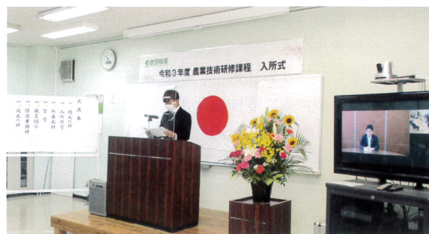
▲新型コロナウイルス感染対策のため リモート形式で開催されました

令和3年度は4月6日に久留米研究拠点にて入所式が行われ、4名が研修生として入所しました。冒頭、所長から「勉強だけでは得られない大切なものをたくさん学び、仲間を作り、大きな『目標』、『夢』に向かって成長し、花開くことを期待しています。」と式辞がありました。入所者代表は「これから2年間たくさんのことを学び、周囲の信頼と友情を深め、経験することを大切にしながら努力して参ります。」と宣誓しました。