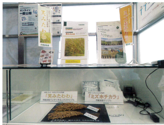
▲サンプルとパンフレット展示の様子

今回出展協力した特別展示のテーマは「お米・米粉の魅力」で、九沖研からは米粉に向く水稻品種「ミズホチカラ」と「笑みたわわ」のパネルとサンプル展示を行いました。九沖研が育成した品種の紹介を通じて、来庁者に向けてお米や米粉の魅力を伝えるとともに、九沖研の研究成果や取り組みをアピールしました。