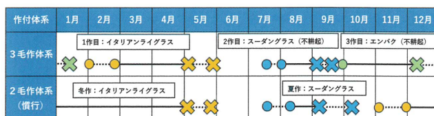
▲図1 新たに導入する3毛作体系と慣行の2毛作体系 ○—○は播種期、×—×は収穫期を示す。

多毛作体系の導入にあたっては、給与対象の家畜の種類や、播種や収穫などの年間の作業量なども考慮した上で、多収となる飼料作物や品種の組合せなどを検討します。当センターでは9月に播種し、12月に収穫できるようなイタリアンライグラスやエンバクの品種を開発しています。このような品種を積極的に導入することで、慣行の冬作と収穫時期を分散させ、年間の作業を平準化するなど、新たな作付体系に取り組めるようになります。