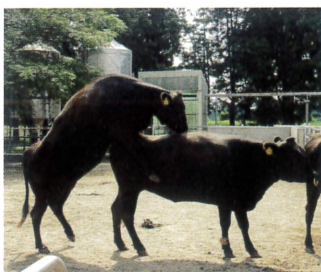
◀写真 乗駕許容行動の様子。一般的な繁殖農家では雌牛だけを飼っており、写真で乗駕している牛も乗駕されている牛も雌牛。下で乗駕されている牛が発情牛。

牛の発情を見つけるための手がかりとして、他の牛に後から乗駕されても(乗りかかられても)逃げずに受け入れる“乗駕許容行動”をはじめとした発情時の特別な行動があります(写真)。しかし、近年、農家の大規模化や労働力不足によって牛一頭当たりには割ける管理時間が減少しているため発情の見逃しが増加しています。また、夏季の高温環境下では、発情時の特別な行動をほとんど、または全くしない不明瞭な発情(鈍性発情と言います)が増加することが知られており、発情見逃しの一因となっています。約21日に1回しかない発情の見逃しは繁殖農家にとって交配の機会を失う重大な問題であることから、省力的かつ不明瞭な発情も検知可能な精度の高い発情検知システムが求められています。