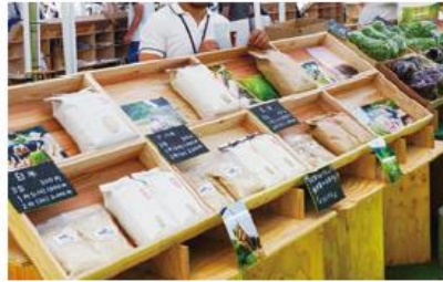
②マルシェ用陳列什器