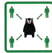
くっつかないモン #KeepDistance