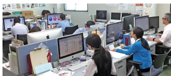
デザイン・制作ルーム