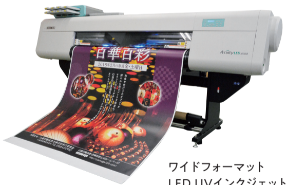
ワイドフォーマット LED UVインクジェット

1,600mmの3層ワイドLED UVインクジェットプリンター、ホットラミネーター、カッティングプロッター等を備えており、屋外看板、ウィンドウ装飾、自動販売機や車のラッピングなど、幅広いサイン・ディスプレイのご要望に対応致します。