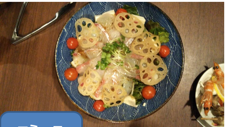
コミュニケーション