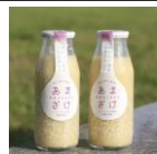
ほんわか玄米あまざけ